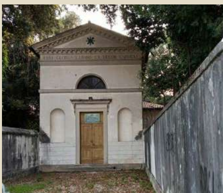
MADONNA DEL CARMELO LOC. CESOLLE