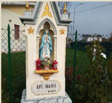
MADONNA CON BAMBINO ALL'INCROCIO FRA VIA PIO VI E VIA VECELIO