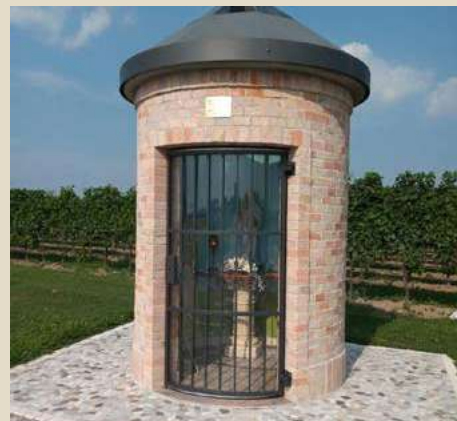
MADONNA DI FATIMA VIA GRENTINE