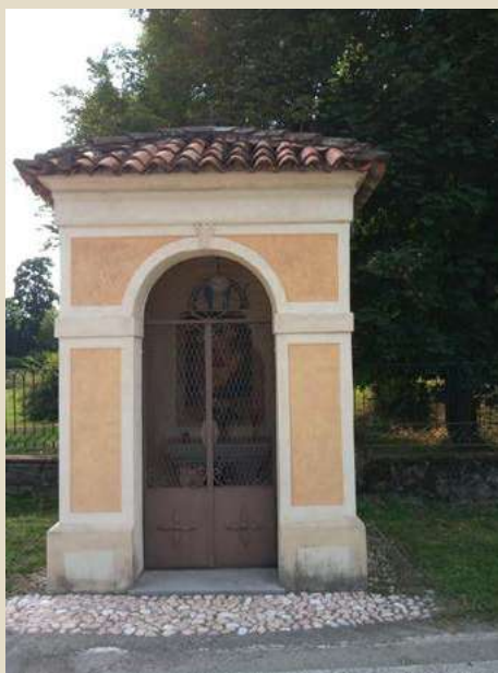
MADONNA CON BAMBINO VIA MARCONI