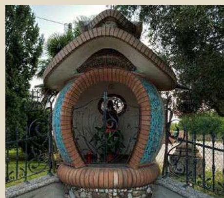
VIA ISONZO MADONNA DEL BUON CAMMINO