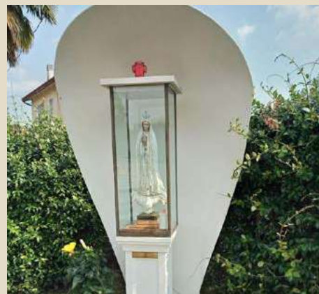
MADONNA DI FATIMA STRADA DEI VEGRI