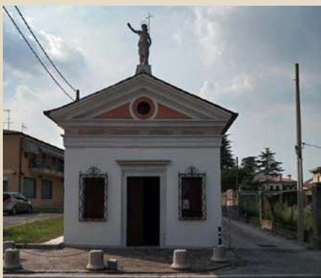
PIAZZA SAN GIOVANNI -CHIESETTA DI SAN GIOVANNI