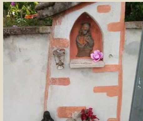
MADONNA CON BAMBINO VIA BUONARROTI