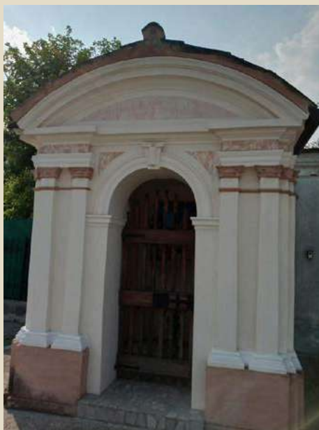
SACRA FAMIGLIA VIA BARCADOR