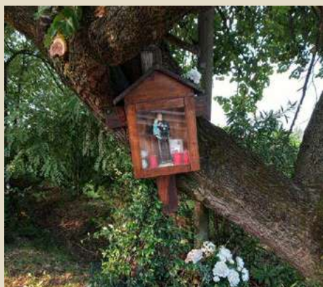
VIA FONFA S. ANTONIO DA PADOVA