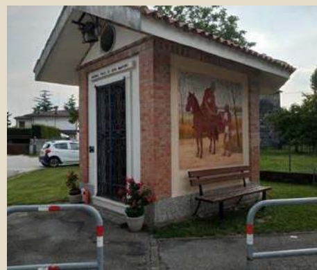
SAN MARTINO CALESSANI