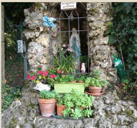
MADONNA DI LOURDES VILLA SINA