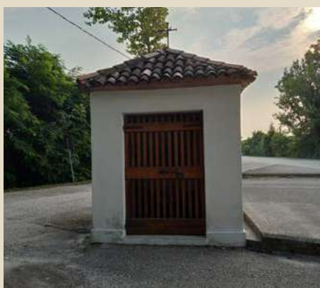
BORGO BUSCO S. ANTONIO ABATE