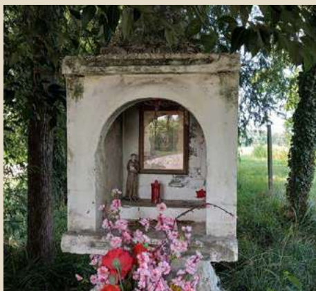
MADONNA DELLE VITTORIE VIA GRENTINE