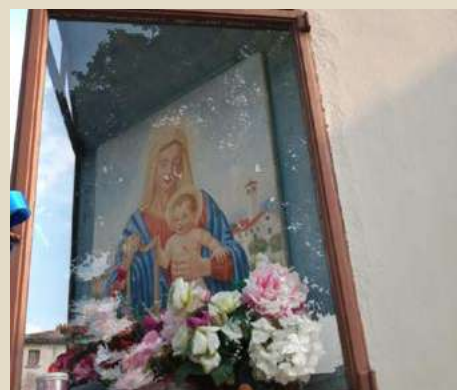
MADONNA DELLA CINTURA PIAZZA DELLA REPUBBLICA