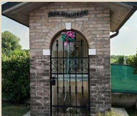
VIA XXIV MAGGIO MADONNA AUSILIATRICE