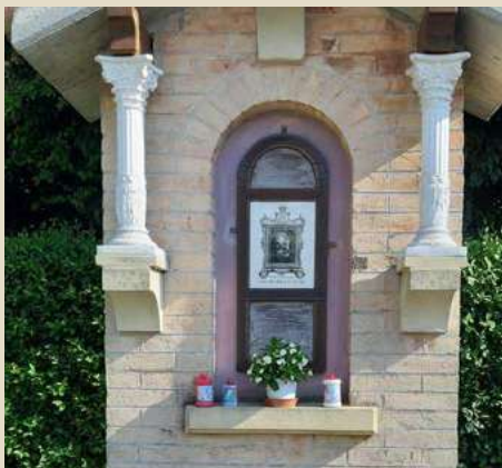
MADONNA DELLE VITTORIE VIA VECELLIO