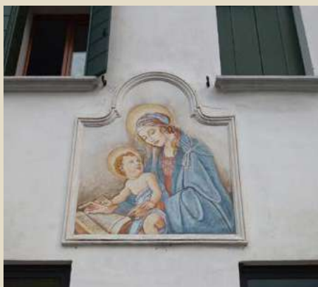
AFFRESCO MADONNA DEL LIBRO