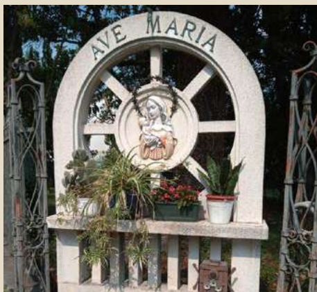
VIA DEI GIUSEPPINI ANNO MARIANO