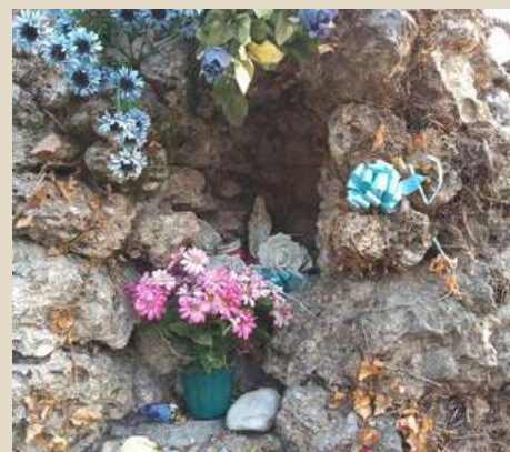
VIA CADUTI PER LA LIBERTÀ MADONNA DEL RICORDO