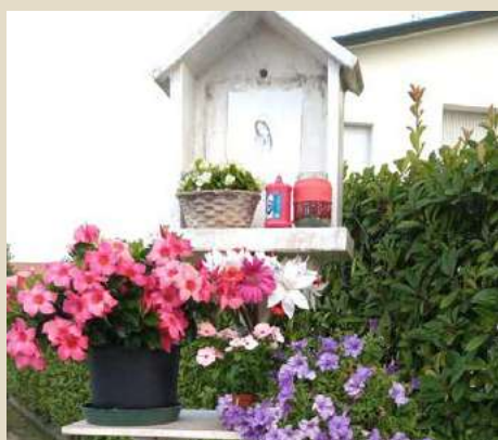
VIA BUSCO MADONNA DEL CARMELO