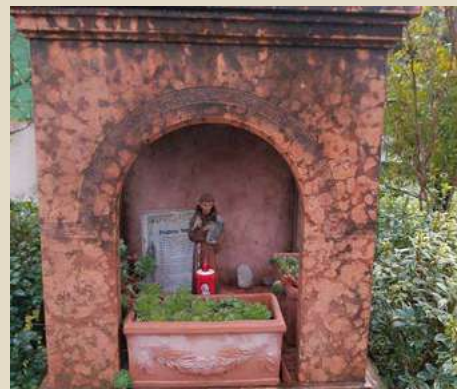
CAPITELLO A SAN FRANCESCO IN VIA S. FRANCESCO