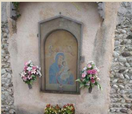
MADONNA DEL PERPETUO SOCCORSO VIA DEI CIPRESSI