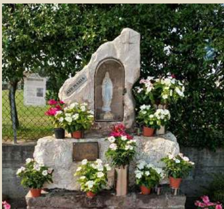
MADONNA DEL BUON RITORNO VIA MADONNETTA