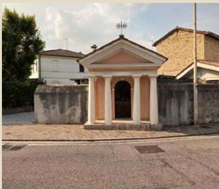
SACELLO DELLA MADONNETTA VIA LOVARINI