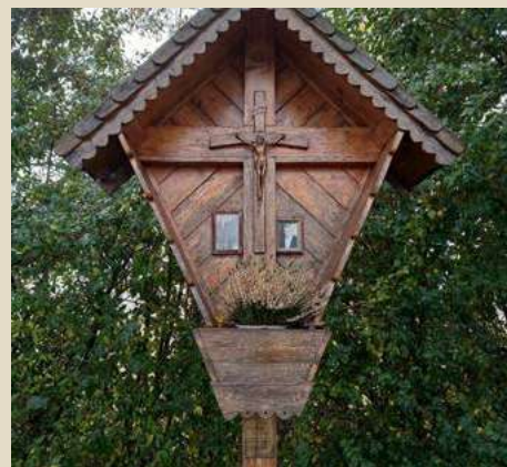
A CRISTO CROCISSO SITUATO IN STRADA DEI MURAZZI